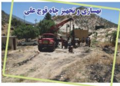
بمسازی و تجهیز چاه قوچ علی