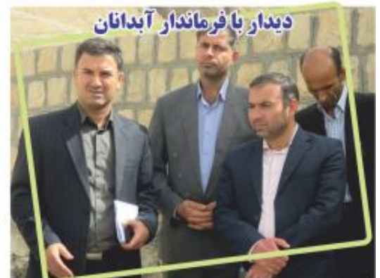
دیدار با فرماندار آبدانان