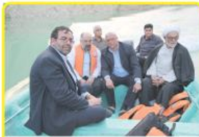
بازدید مشاور فرهنگی وزیر نیرو از سد ایلام

حجت الاسلام والمسلمین علی یزدانپرست مشاور وزیر و رئیس شورای فرهنگی وزارت نیرو، در طی سفر به استان ایلام با مدیران صنعت آب و برق و مسئولین فرهنگی استان دیدار و گفتگو کرد و در پایان سفر به استان در مراسم تجلیل از جانبازان شرکت آبفای ایلام، که در نمازخانه برگزار شد شرکت نمودند.