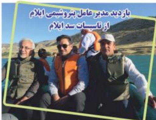
بازدید مدیر عامل پتروشیمی ایلام از تاسیسات سد ایلام