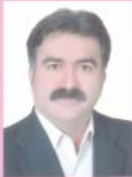
دفتر آمار و فن آوری اطلاعات

با توجه به اینکه اکثر خدمات مورد نیاز جامعه بصورت اینترنتی ارائه شده و در بیشتر موارد اطلاعات مهمی همچون نامه های اداری، مشخصات فردی، صورت حساب بانکی و... در حال رد و بدل است لذا امنیت و حفاظت از شبکه ها امری ضروری و اجتناب ناپذیر می باشد.