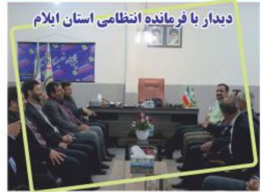
دیدار با فرمانده انتظامی استان ایلام