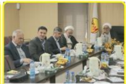
نشست مسئولین فرهنگی وزارت نیرو با مدیران صنعت آب و برق استان ایلام