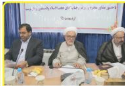
نشست مسئولین فرهنگی با مشاور وزیر نیرو