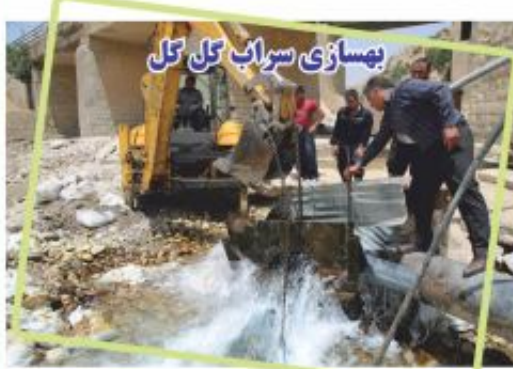
بمسازی سراب گل گل