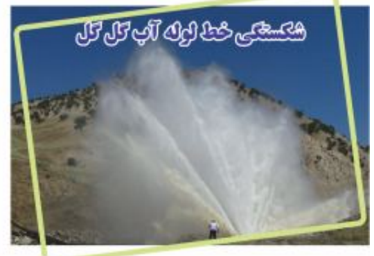
شکستگی خط لوله آب گل گل