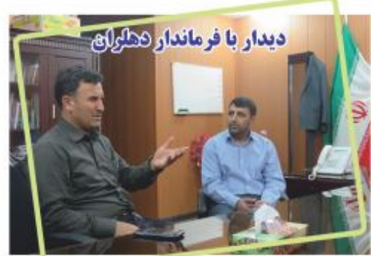
دیدار با فرماندار دهگلان