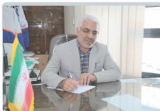
فرآیندها، در اسامی بگیری شد و هم اکنون نیروهای در واحدهای مربوطه مشغول به فعالیت هستند.

بخش منابع انسانی: در قبال ریزش های انجام گرفته در بحث منابع انسانی در بخشهای مختلف شرکت و بر اساس دستور العمل اجرایی استخدام در شرکت های وابسته غیر دولتی و با پیگیریهای مقام محترم مدیر عامل موفق به کسب مجوز جذب ۷ نفر در مقطع کارشناسی به بالا از طریق آزمون در سال ۹۴ شدیم که در همان سال فرآیند های آزمون، تطبیق مدارک، مصاحبه انجام گرفت مابقی