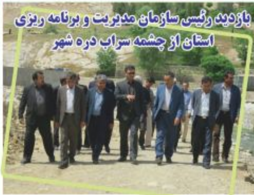
بازدید رئیس سازمان مدیریت و برنامه ریزی استان از چشمه سراب دره شهر