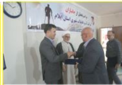
تجلیل از جانبازان شرکت آبفای استان ایلام با حضور مشاور فرهنگی وزیر نیرو