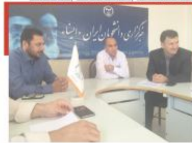
بمناسبت هفته صرفه جویی در مصرف آب صورت گرفت: حضور مدیر عامل شرکت آبفای شهری در میزگرد کارشناسی خبرگزاری ایسا استان ایلام

۷- در صورت مشاهده هر گونه مشکل در زمینه امنیت شبکه با کارشناسان دفتر فناوری شرکت تماس حاصل فرمایید.